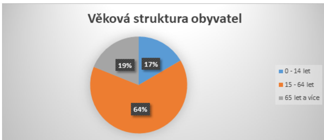
Obrázek č. 1 : Věkové rozložení obyvatel v obci Račice k 31. 12. 2019

Aktuální počet obyvatel obce je 344 (k 31. 12. 2019). Počet obyvatel obce je poměrně stabilní. Od roku 2011 vzrostl počet obyvatel o 25. Na přírůstek obyvatel má vliv zejména počet přistěhovalých. V roce 2011 bylo v Račicích 125 domácností. Podíl dětí do 15 let dosáhl v roce 2019 hodnoty 17 %. Lidí v ekonomicky aktivním věku žije v obci 64 %. Průměrný věk obyvatel se drží okolo 42 let. V obci žije 46 % mužů a 54 % žen.