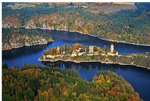
Letecký pohled na hrad