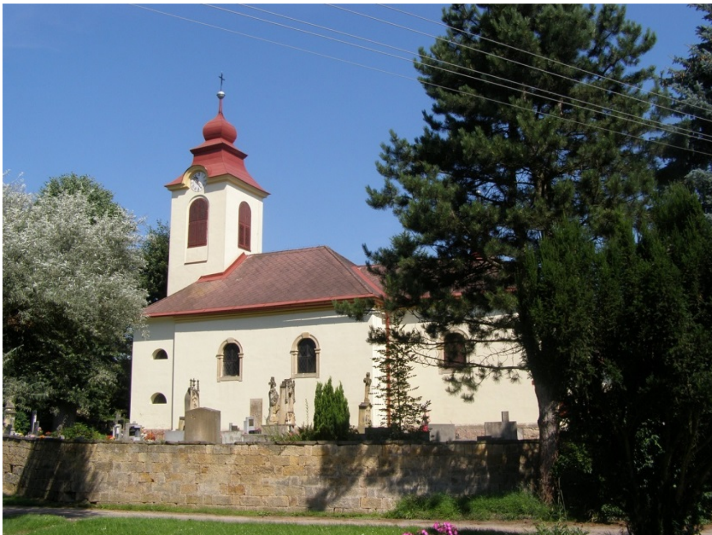
Obr. 5 Kostel svatého Mikuláše

V obci je dále umístěna na domě číslo popisné 4 pamětní deska místního rodáka, hudebního skladatele, varhaníka a Mozartova souputníka, Jana Křtitele Kuchaře.