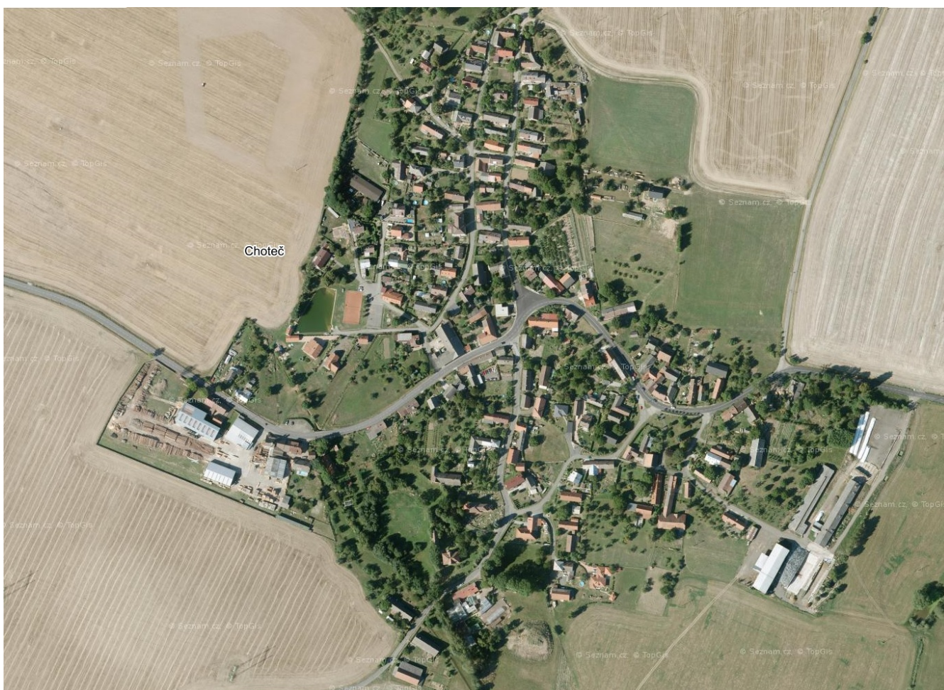
Obr. 3 Letecký pohled na obec Choteč

Obec Choteč leží v Královéhradeckém kraji na silnici II. třídy č. 501 spojující Jičín s Lázněmi Bělhrad, přibližně 12 km východně od Jičína a 5 km západně od Lázní Bělhrad. Rozkládá se v Jičínské pahorkatině, v mělkém úvalu Chotečského potoka (který se u Šárovcovy Lhoty vlévá do Javorky), v nadmořské výšce od 300 m (rybníček za Jiránkovými) po 320 m (vrcholek Habru). Katastrální území zaujímá rozlohu 608 ha.